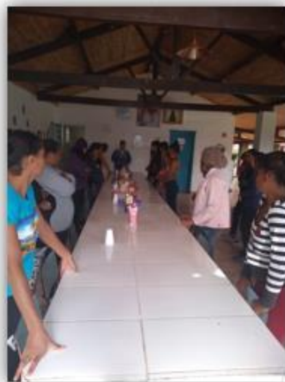
Café da manhã preparado pelas alunas